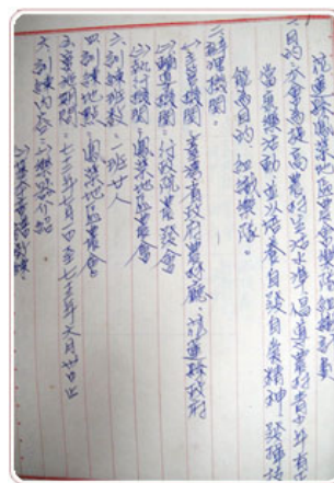
圖1 花蓮縣鳳榮地區農會樂隊組織計畫

農會對於農民之照顧一向不遺餘力，對於農民的人生大事－結婚，也訂定了相關的福利措施。花蓮縣鳳榮地區農會管有檔案中，發現1件由臺灣省農林廳訂定「舉辦核心農民團體結婚典禮實施要點」之檔案，該要點內容說明參加集團結婚，除了贈送洗衣機等結婚禮品外，結婚證書、請柬及相關服務人員之指派，均由臺灣省農會辦理，以反映為鼓勵農村青年留鄉從農之用心。