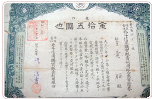
圖3 北斗信用購買販賣利用組合出資證券

農會前身之產業組合係以日據時期各市庄街行政區域為組織範圍，由各該區域的居民出資籌設。組合資金的來源包括內部資金及外部資金。內部資金包括股金、公積金及準備金等，每股金額按各組合章程辦理。一般而言，每股金額分別為10円、15円及20円(日幣)。北斗鎮農會留存組合時期之股金，可見證早期農會依合作經濟發展原理建立之股金制度。