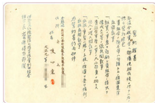
圖5 農會前身組合時期之誓約保證書