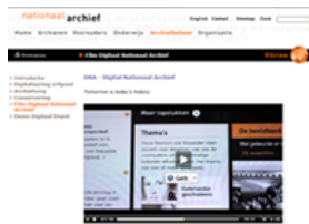
圖6：國家檔案館檔案檢索系統