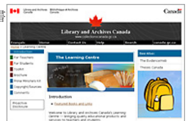
加拿大圖書及檔案館線上學習中心網站

為了讓加拿大的教師與學生擁有更豐富的教育學習資源，加拿大圖書及檔案館利用其特色館藏建置線上學習中心，包含各式經數位化的館藏，如文件、日記、地圖、手稿、圖片或音樂等，以及網站、教育工具等資源，且內容隨時依館藏新增而增加，而多數的教育資源係諮詢教育學者專家依其建議而建置。所有教育資源的提供，旨在提升學生對的想像力及獨立思考的能力，同時也協助教師將歷史與文學教育融入至學生生活中。以下分就提供教師教學及學生學習的資源加以介紹。