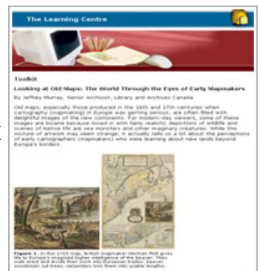
Toolkit教學範例：古地圖使用說明