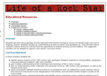
教學資源範例：Life of a Rock Star課程頁面

學習中心除提供教師完整的教學資源、指引及課程學習計畫外，為協助教師設計課程及學習教學技巧，該網站並提