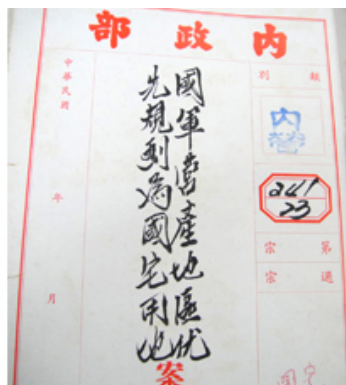
圖1軍眷村合建國宅相關檔案

83年，民間開始積極參與低收入住宅興建，且有政府直接補助，如臺糖公司非常積極的提供各處土地興建勞工平價住宅。同時，政府亦積極推動軍眷村改建國民住宅，按眷村分布位置，依條件相近者整體分區規劃，運用既有之眷村土地，安置眷戶或提供中低收入戶承購，故有關勞工住宅及眷村改建之規劃協商、問題解決及土地取得等案情之檔案(圖1)，可呈現政府在當時推動軍眷村合建國宅及勞工住宅政策上之作為與過程，亦相當具有資訊價值。