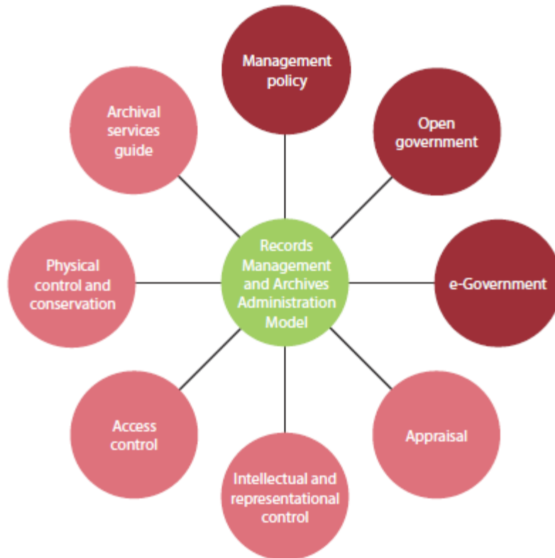
圖 1 MGD 模型執行指南