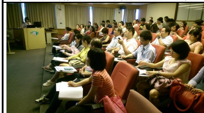
電子檔案保存實驗室程式設計師辦理訓練上課情形