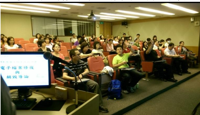
103 年度電子檔案技術訓練學員上課情形