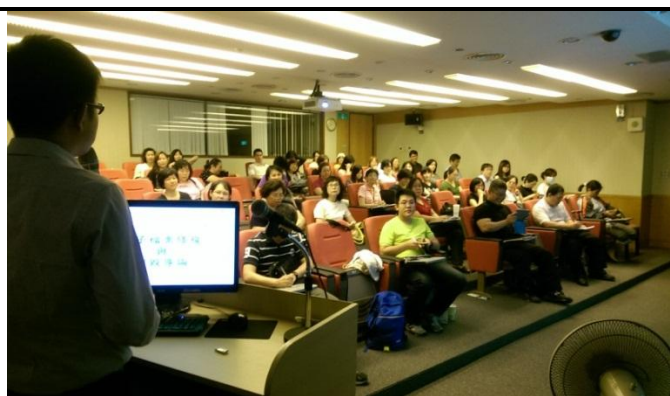
電子檔案保存實驗室技術服務專員辦理訓練上課情形