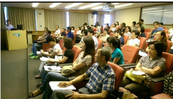
電子檔案保存實驗室系統分析師辦理訓練上課情形