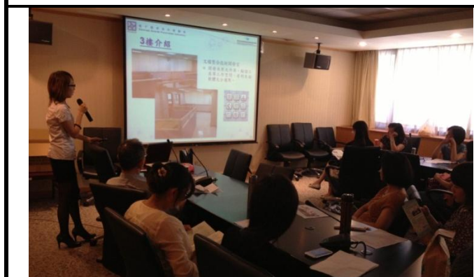
電子檔案保存實驗室技術服務專員辦理訓練上課情形