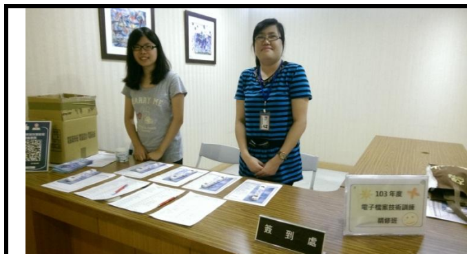
辦理 103 年度電子檔案技術訓練簽到處