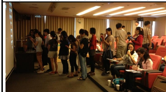
訓練學員參與電子檔案保存實驗室粉絲專業打卡按讚情形